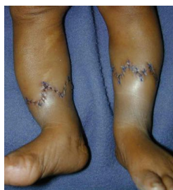
Malformazione degli arti inferiori causata da briglie amniotiche. Se l'equipe di Interethos non fosse intervenuta il bimbo con la crescita sarebbe andato incontro alla perdita dei piedi.